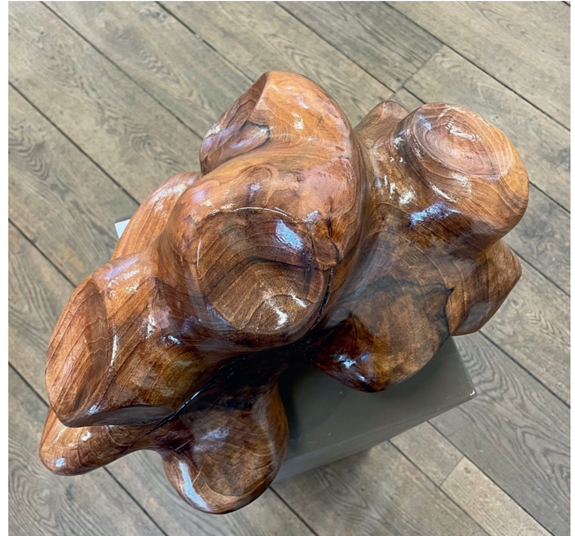
Sealed Heart Walnussholz, Lack 46 x 39 x 35